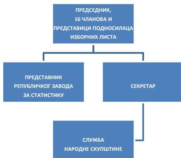
(Графички приказ организационе структуре Републичке изборне комисије – ПРОШИРЕНИ САСТАВ)

Приликом спровођења избора Комисија ради у ПРОШИРЕНОМ саставу и чине је, поред председника, чланова, секретара, њихових заменика и представника републичке организације надлежне за послове статистике, и по један представник подносилаца изборних листа, односно предлагача кандидата за председника Републике.